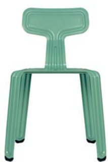
Tussi-Türkis drama-queen-green NCS S 3030-B70G