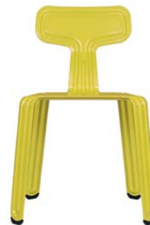
Scharfer-Senf hot-mustard NCS S 10602-G90Y