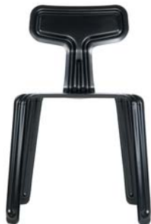
schwarz/black RAL 9005