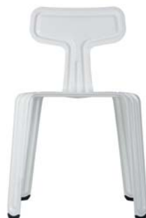
weiß/white RAL 9010