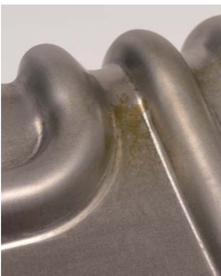
1 - 3 Pressspuren/ marks of pressing