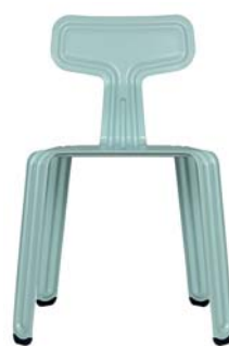
Frühtau-Blau morning-dew-blue NCS S 1515-B50G