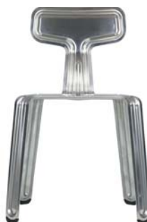
Sonderedition special edition