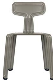
Chiemsee-Schlick lake-Chiemsee-silt NCS S 6005-Y20R