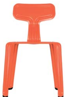
glänzend glossy finished