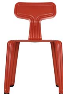
rot/red RAL 3000