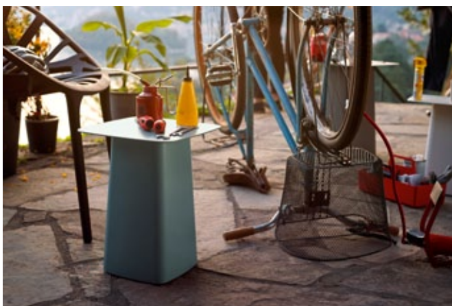
Metal Side Table (Outdoor)

In der pulverbeschichteten Variante mit Feinstruktur sind die Metal Side Tables wetterfeste Beistelltische für Garten und Balkon. Die Tische lassen sich perfekt mit dem drinnen und draussen einsetzbaren Sessel Waver kombinieren, dessen Untergestell in denselben Farben erhältlich ist.