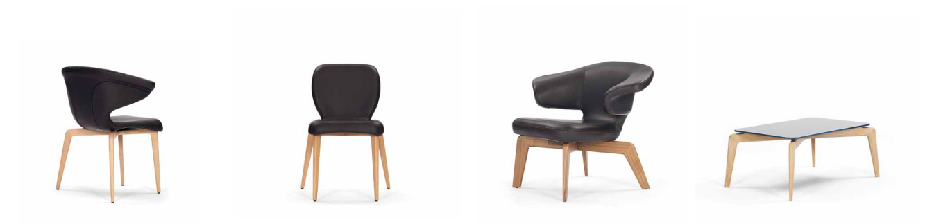
MUNICH ARMCHAIR 2009